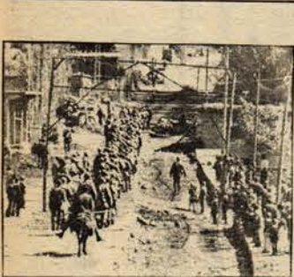
Beytüşşebap' ta komando ablukası