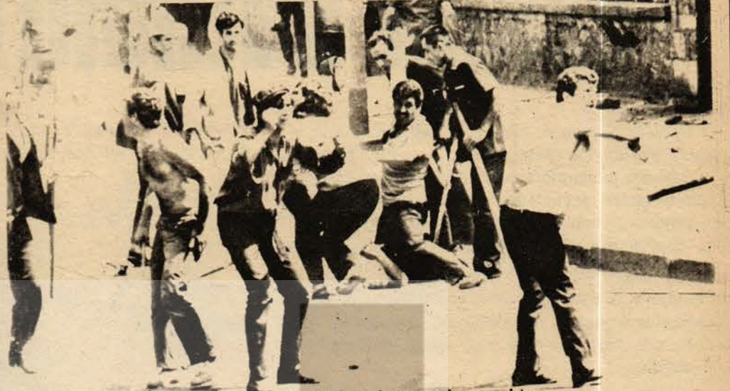
«İşçi sınıfı faşist planları boşa çıkaracaktır»